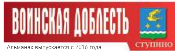
Альманах выпускается с 2016 года

На задней обложке: «Мать. 30-е годы». Из серии «Русская женщина» И. Н. Воробьева. Из фондов Ступинского историко-краеведческого музея.