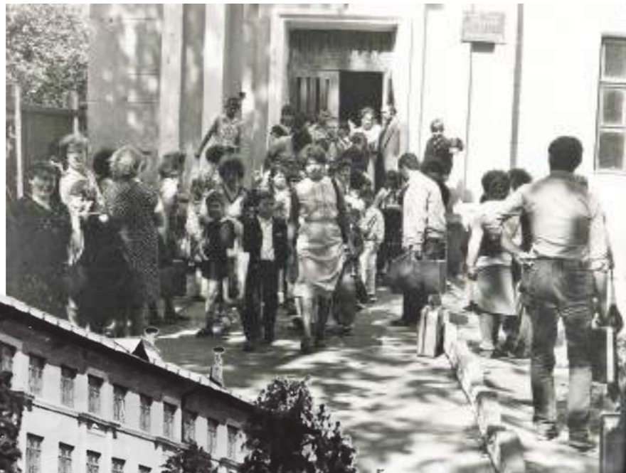
Отправка детей в пионерский лагерь «Березка» от 1-й школы. 1988 год.