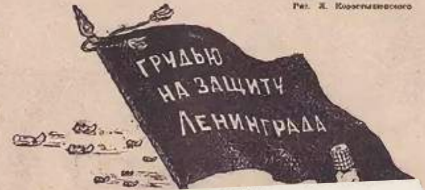
Рис. Ж. Коростелевского

Революционная бдительность — обязательная черта каждого советского воина. Особенно бдительными мы обязаны быть сейчас, в дни великой отечественной войны. Чтобы успешно осуществить боевую задачу, надо хранить и строжайшей тайне подготовку к ней. Отсюда вывод: соблюдение военной тайны — закон жизни каждого бойца.