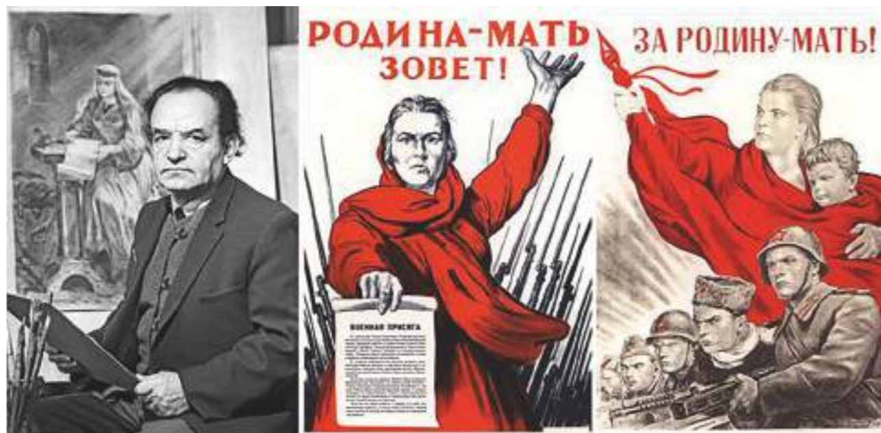
➤ Художник Ираклий Тоидзе. Автор плаката «Родина-мать зовёт!».

Образ Родины-матери был одним из самых распространенных в годы Великой Отечественной войны. В короткие минуты затишья между боями сыновья писали весточку домой: «Здравствуй, мама!», с именем матери на устах бойцы шли в атаку и в предсмертные минуты звали тех, кто им подарил жизнь. Одна из самых страшных войн человечества 1941–1945 годов показала живущим во всем мире людям, что из себя представляет материнство, вылившееся в настоящий патриотизм.