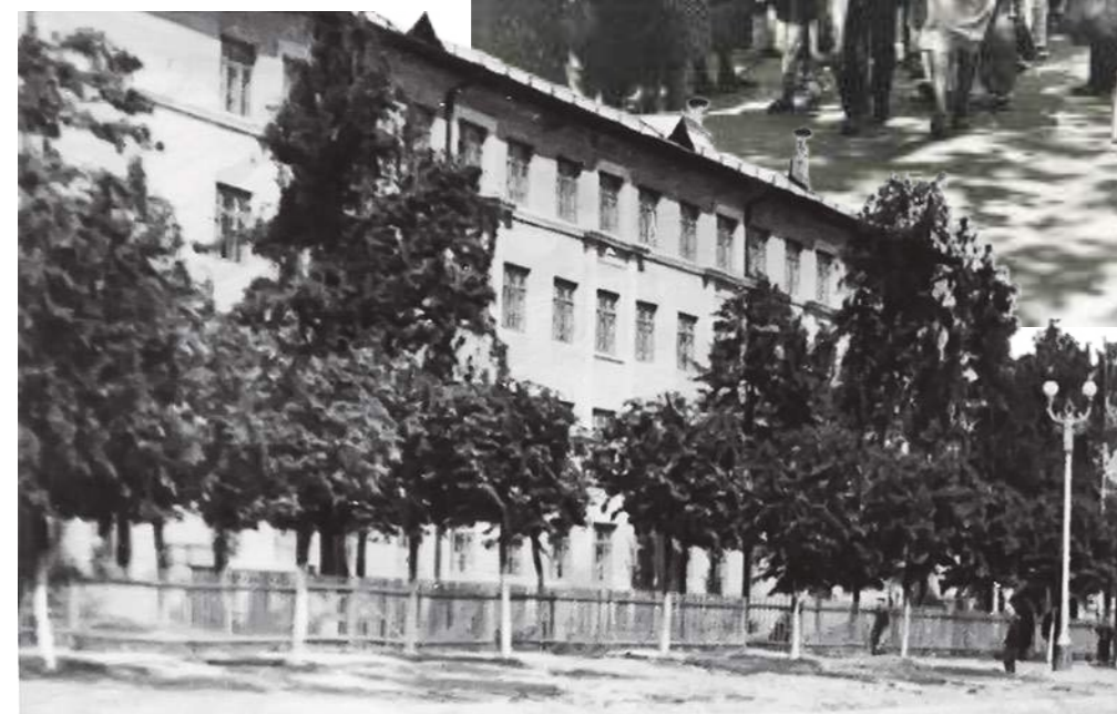
Здание средней школы № 3 (ныне № 1). 1938-1957 гг.