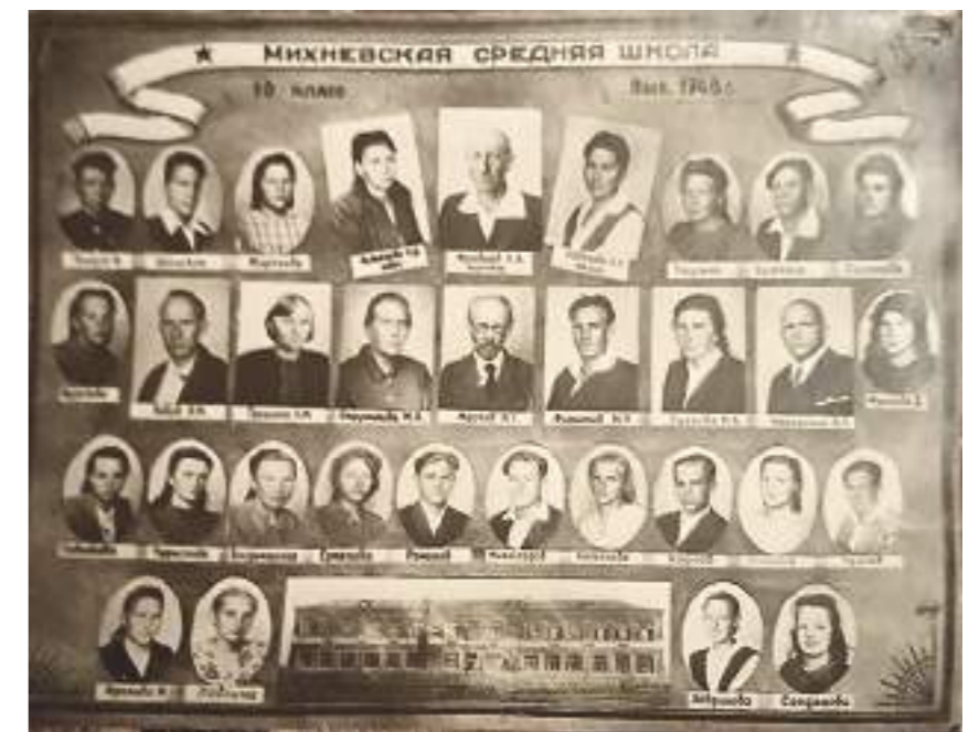
Михневская средняя школа. Выпуск 1948 года. 10 класс.

на рытье противотанковых окопов под городом Брянском, в свою очередь педагогический состав школы № 1 помогает истребительному батальону разместиться в школьных кабинетах. Учителя города и района активно поддерживают фронт, работая на полях колхозов, перепрофилируя для военных нужд все станки