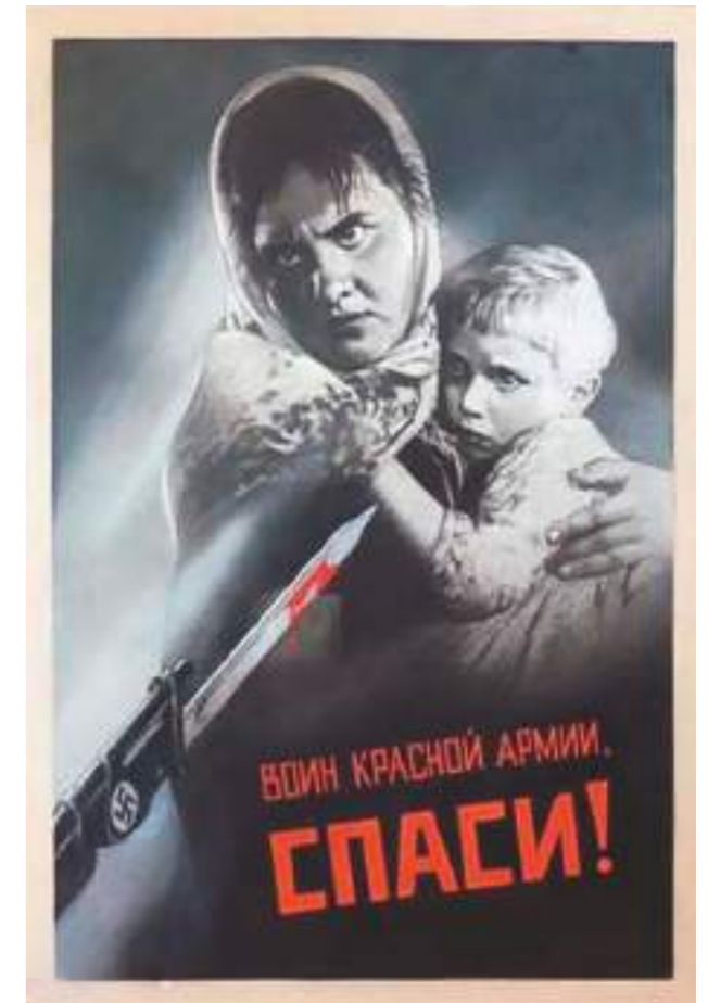
➤ В. Корецкий «Воин Красной армии, спаси!».

Матери... Это они в муках дарят жизнь своим детям, а потом проводят бессонные ночи у их колыбелей. Это они отдавали последний кусочек от своего пайка дочерям и сыновьям в блокадном Ленинграде и в оккупации, уверяя своих детей, что совсем не голодны. Они, матери всех воинов-освободителей, защитили русскую землю и народы от захватчиков. И именно эти женщины, проявляя жертвенность, не жалея себя ради будущего своих детей, ради того, чтобы жизнь продолжалась, совершали подвиг — подвиг материнства.