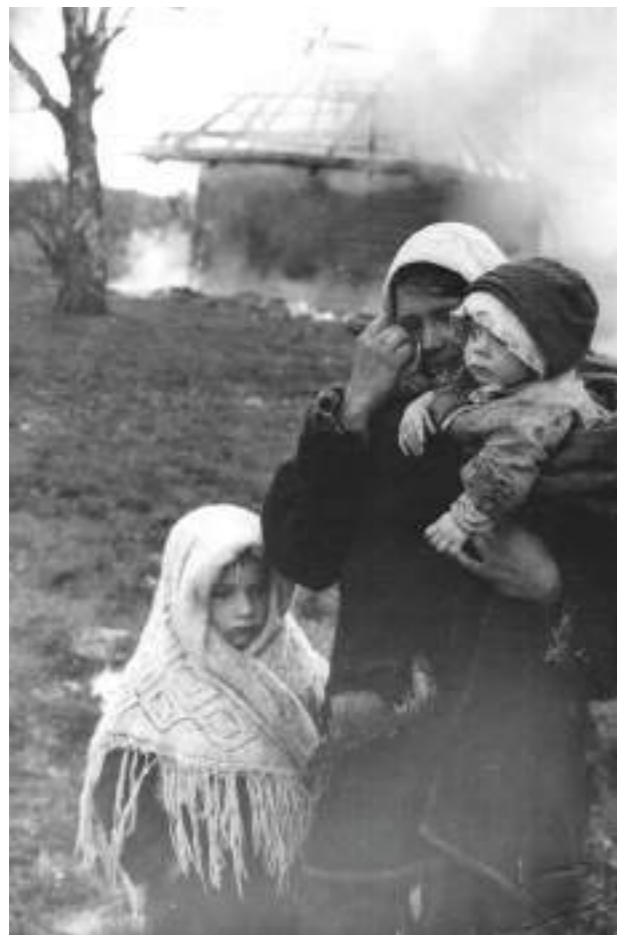
▶ Женщина с детьми у сгоревшей хаты в деревне Серболово Псковской области. 1942 год.