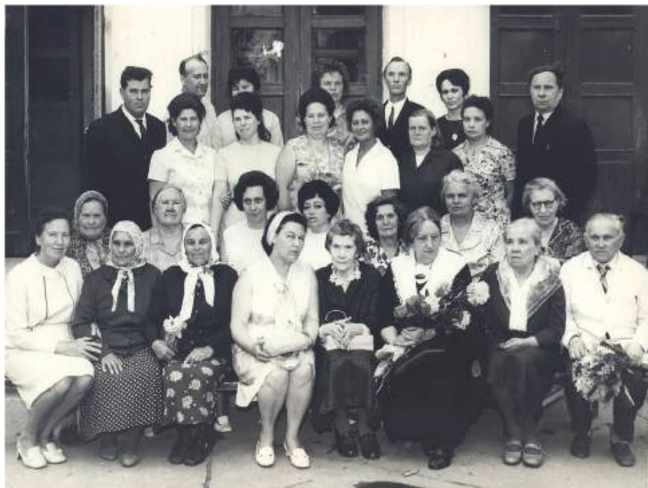
Послевоенное фото педагогического коллектива школы № 2.

Шел 1944 год. Великая Отечественная война была в самом разгаре, а Совнарком СССР выпускает постановление «О мероприятиях по улучшению качества обучения в школе». Теперь для выпускников, окончивших средние образовательные учреждения полагались медали. Золотая медаль выдавалась тем выпускникам, которые имели отличное поведение и оценку «5» по всем предметам. Серебряную медаль получали те, кто имел отличное поведение и оценку «5» по предметам, отнесенным к экзаменам на аттестат, и оценку «4» не более чем по трем из остальных предметов. Кроме того, согласно образовательной реформе, меняется и организация образовательного процесса, которая касается и Ступино. Таким образом школа № 3 становится «мужской» (теперь это школа № 1), а школа № 2 — «женской».